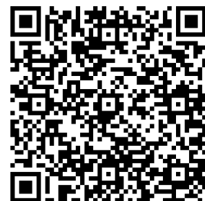
Link zum Herz-Hirn-Logo

https://www.stille-stunde.com/wp-content/uploads/2025/09/Ausweis-Behinderung.pdf