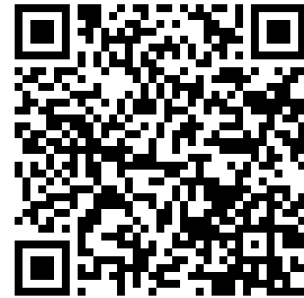
Link zum Ausweis